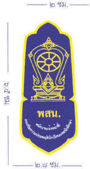
ขนาดเท่าของจริง